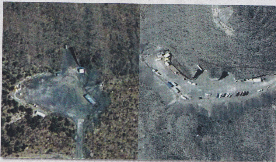
Az 51-es körzet föld alatti bázisainak bejáratai, ahol állítólag földönkívüli technológiákat vizsgálnak