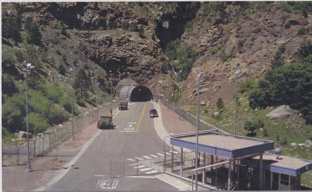
A gránithegy alatt található labirintusszerű létesítményt a Légierő Ūrparancsnoksága üzemelteti

és rakétasilókban, amiket átalakítottak. A cég így hirdeti magát: „Az emberiség tartalék terve. Biztosítsa helyét egy Vivos föld alatti menedékhelyen, hogy túléljen gyakorlatilag minden katasztrófát!” A cég privát lakosztályokat kínál egyének vagy családok számára, valamint nagyobb közös helyiségeket medencékkel, játékokkal, filmekkel és étkezővel. Az olyan elit mene-