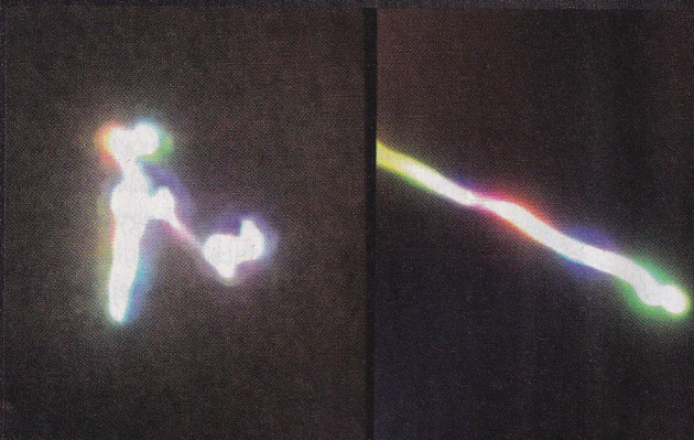
A Tiszaföldvári több színben vibráló jelenség fotói

Az USA médiája rendszeresen foglalkozik a legújabb UFO-, vagy ma már inkább UAP-nak hívott azonosítatlan tárgyak észleléseivel. Az elmúlt években több katonai eredetű felvétel szivárgott ki, amelyeken gyorsan repülő, gömb alakú objektumok láthatók. Ezek az eszközök olykor kétéltűek is lehetnek, ugyanis képesek a levegőből a víz alá merülni. Az Egyesült Államok Védelmi Minisztériumának hivatala, az AARO (All-domain Anomaly Resolution Office - Minden területet érintő anomáliák feloldásával foglalkozó hivatal) részlegesen folyamatosan kommentálja és elemzi ezeket a felvételeket. A szervezet nemrég lemondott igazgatója,