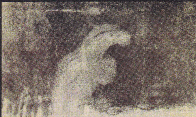
A szellemkezek által készített rajzokat Hillebrand Jenő tette közzé 1940-ben

megjelenhet, de ehhez nem kellene a szellemek. A kutatók észrevették, hogyha minél közelebb helyezkednek el a médium testéhez, annál erősebben érzik a plazma jelenlétét. Tehát nem a bárhol felbuk-