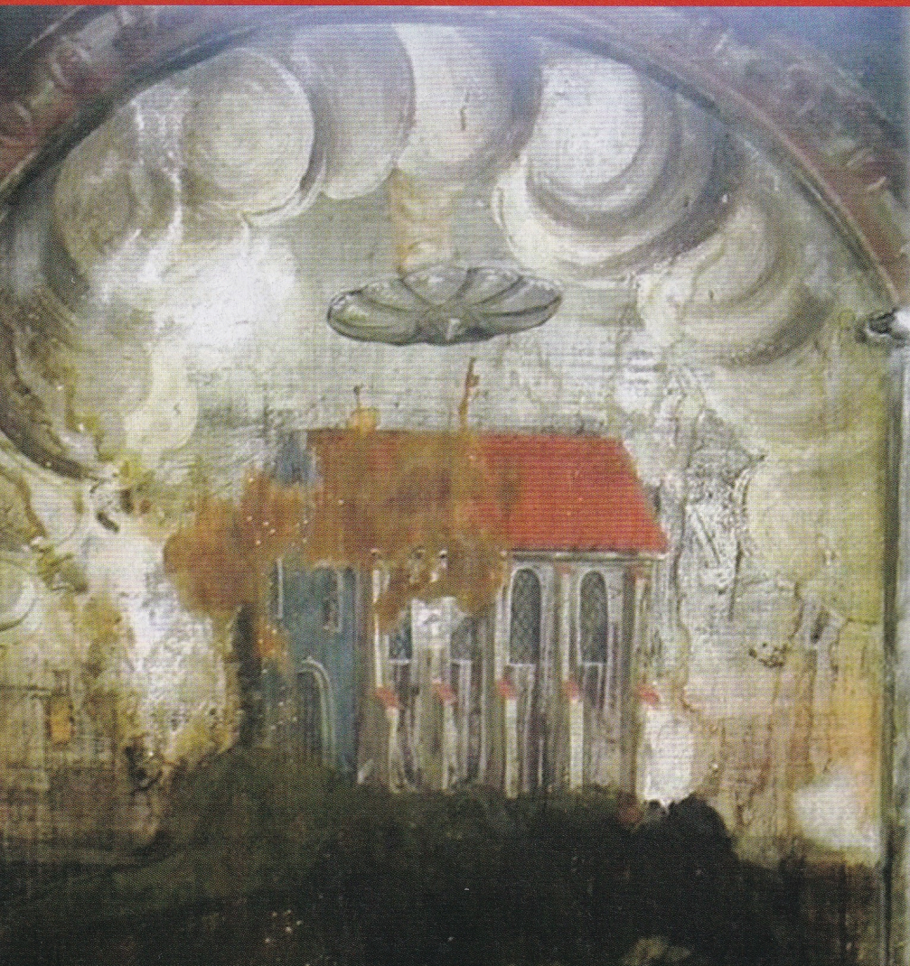
Pár éve tűnt fel a látogatóknak a templomban található 400 éves falfestményen, hogy egy UFO-t ábrázol

Évtizedek óta észlelnek földönkívüli tevékenységeket Erdélyben. Vajon miért közkedvelt hely ez az UFO-k számára? Egyes amatőr történészek szerint már az ősidőkben is szálltak le űrhajók ezen a területen, mások pedig a modern jelenségeket kutatták. Vizsgáljuk meg, hogy mennyire hitelesek ezek az esetek!